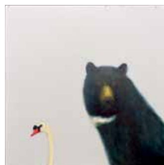
boven Joris Collier: 'Beer en Zwaan', 2013. Olieverf op doek, 150 x 150 cm. Te zien bij Galerie de Vis.

Bezoeken Realisme Passenger Terminal Piet Heinkade 27 Amsterdam www.realismeamsterdam.com 16-01 t/m 19-01