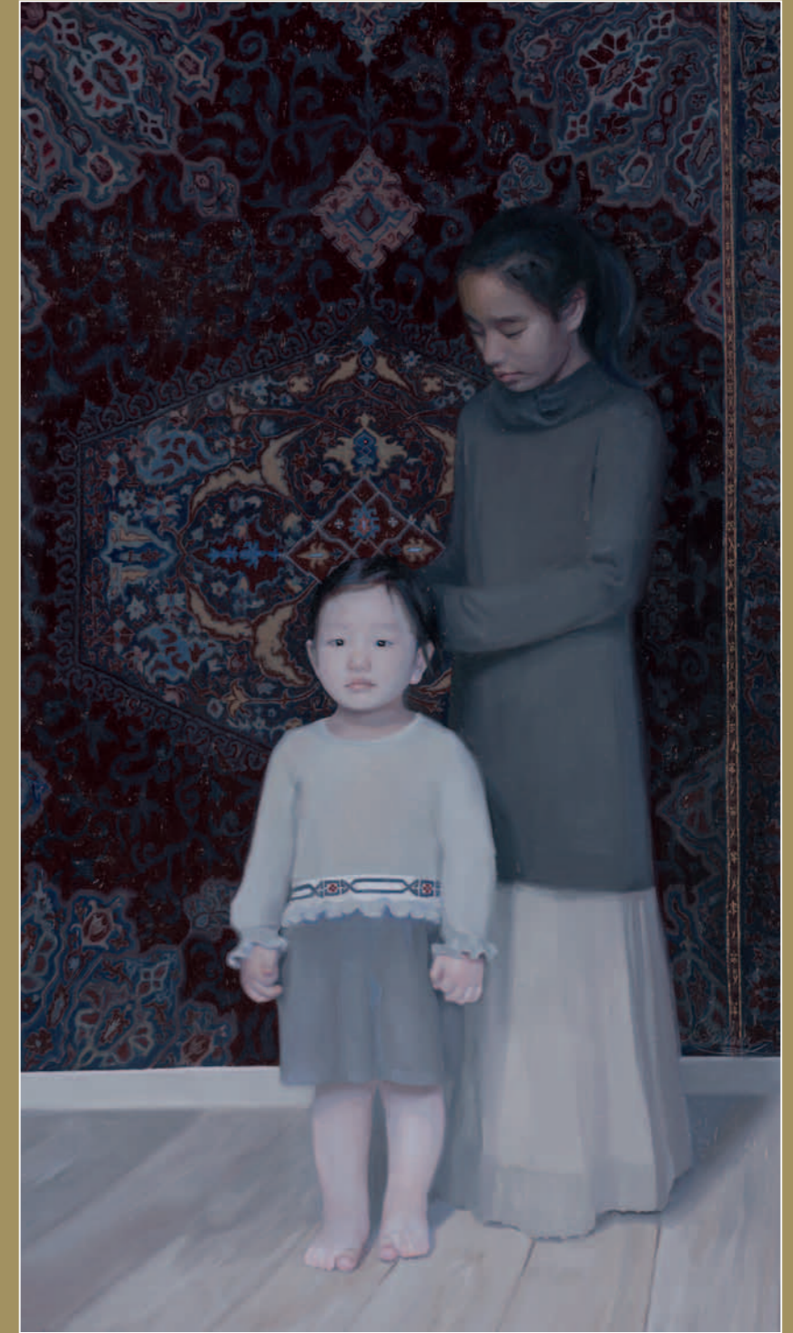
Borte, the Dzjengis Khan wife I, II en II drieluik, olieverf op linnen, links 175 x 100 midden 175 x 122 rechts 175 x 100 2014